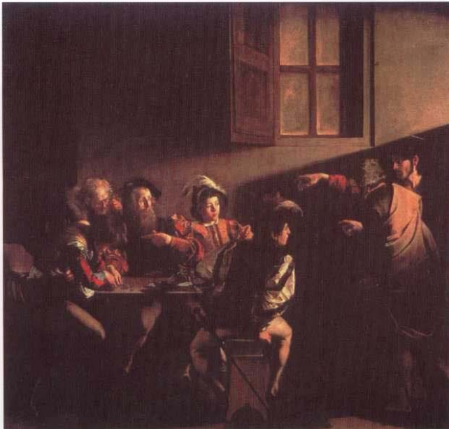
Imagen 2 / Imatge 2 Caravaggio, La conversión de San Mateo . 1600 Caravaggio, La conversió de Sant Mateu . 1600