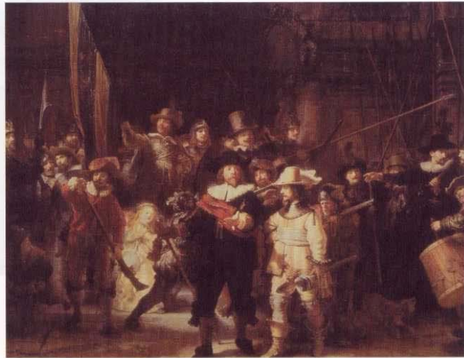
Imagen 1 / Imatge 1 Rembrandt van Rijn, La ronda de noche . 1642 Rembrandt van Rijn, La ronda de nit . 1642