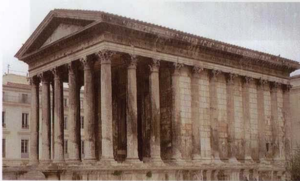
Imagen 2 / Imatge 2

Templo de la Maison Carrée , Nîmes. Siglo I a. C. Temple de la Maison Carrée , Nîmes. Segle I a. C.